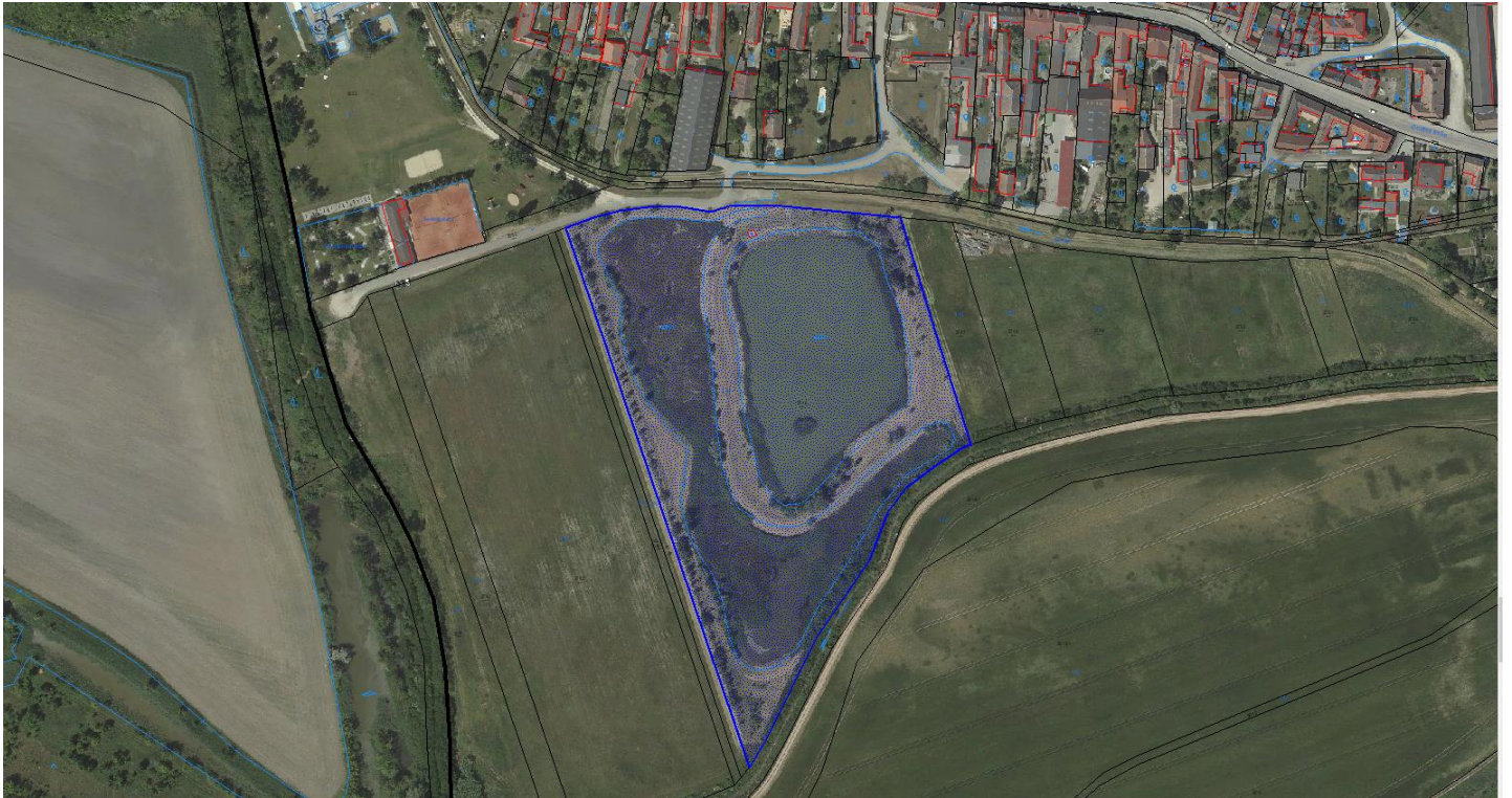
blau markierter Bereich Höllerbiotop

Hierauf bezieht sich die Hundesicherungszone des Gemeinderates vom 15.12.2020.